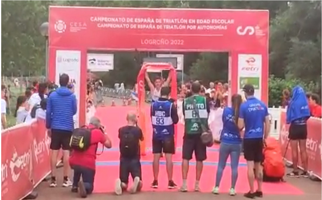
Ano 2022. Un deportista do CN Cedeira, campión de España en triatlón.