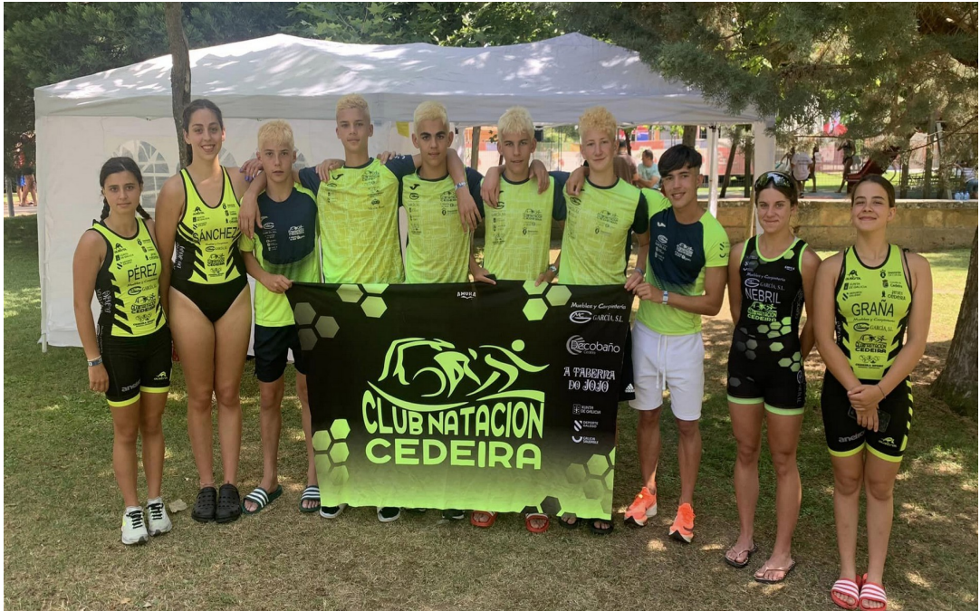
2022. Equipo cadete feminino e masculino. Campión de España de acuatlón.