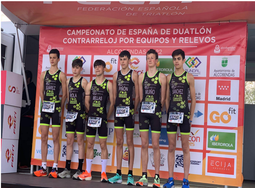
Ano 2022. Equipo Cadete que obtivo varias medallas en diferentes campionatos de España.