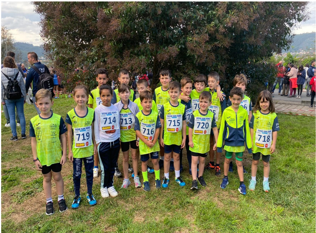
Ano 2022. Equipo benxamín.